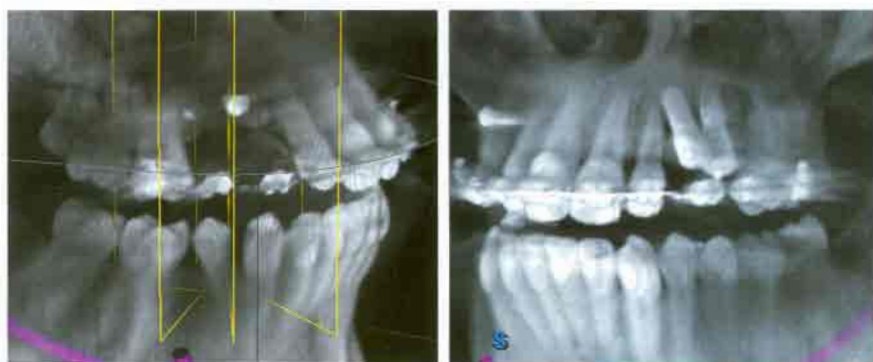
Abb. 2: Nichtanlage der Prämolaren und Eckzähne im Oberkiefer beiderseits mit der chirurgischen Therapie vorangehender kieferorthopädischer Behandlung. – Abb. 2a: Situation nach zwei Rekonstruktionsversuchen. – Abb. 2b: Situation nach Implantation.

Behandlung Beteiligten ein umfassendes Planungs- aber auch Behandlungskonzept erfordert.