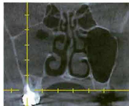
Abb. 1: Planung einer Molarenresektion mit Berücksichtigung des Nebenhöhlenbefundes (Galileos, VTC).

Diese Überlegungen zeigen, dass eine primär so einfach erscheinende Entscheidung für oder gegen eine Wurzelspitzenresektion eines oberen Molaren, für alle an der